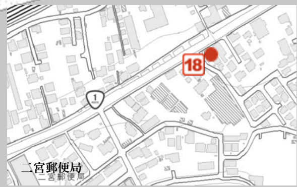
二宮・大磯町境界付近